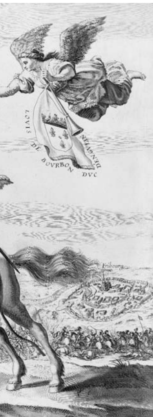
Portrait de Louis II de Bourbon, prince de Condé, à cheval, accompagné de la Renommée devant Fribourg. Buisson et eau-forte, BNF, Estampes et photographie, Rés. Qb-201 (62)-Fol.

Les révolutionnaires de 1789, héritiers des Lumières, ont beau valoriser les mérites des grands hommes et honorer leur mémoire au Panthéon, temple laïc qui leur est consacré à partir de 1791, les urgences et les bouleversements politiques les contraignent à réhabiliter les personnages héroïques. L'historienne Mona Ozouf a clairement établi la distinction entre ces deux figures de l'excellence : « Le grand homme ne doit rien au surnaturel alors que le héros réussit une action qui tient du miracle. Le héros est l'homme de l'instant